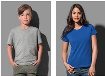
ST2220 Classic-T Organic Kids