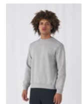
ERHÄLTICH IN UNISEX B&C SET IN